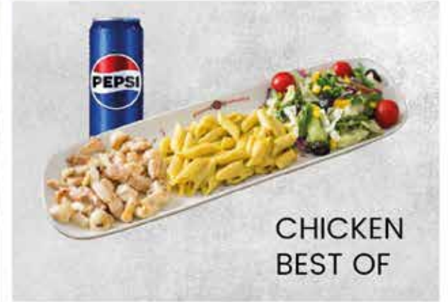
CHICKEN BEST OF